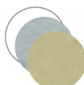
ROTONDA piccola mm 25