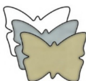
FARFALLA mm 38x29