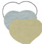
CUORE mm 35x28