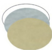
OVALE grande mm 35x23