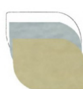
STONDATA mm 35x25