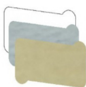
PERGAMENA mm 32x20