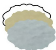
NUVOLETTA mm 35x23