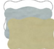
NUVOLA mm 35x25

Etichette disponibili di colore oro, argento o bianche. Stampa ad 1 colore