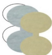
DOPPIO OVALE mm 35x25