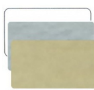
RETTANGOLARE mm 35x22